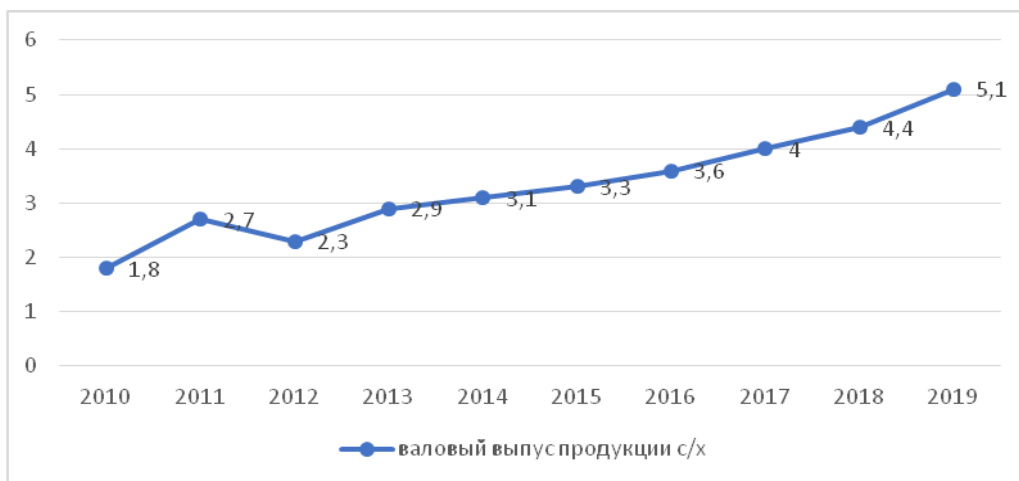
Рисунок 1 – Динамика валовой продукции сельского хозяйства с 2010 по 2019г. (трлн. тг) [3]

Вопреки относительно низкой доли инвестиций в основной капитал 4,6% за 2019г. объем инвестиций за январь-сентябрь 2020г. составил 380,6 млрд. тг, превышая соответствующий период 2019г. на