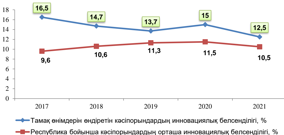
Ескерту: [қараңыз 12] негізінде авторлармен құрастырылды 3 сурет – ҚР бойынша тамақ өнімдерін өндіретін кәсіпорындардың инновациялық белсенділігі, %

елдерде кәсіпорындардың инновациялық белсенділігі орташа 48,9%-ды құрайды, ал Польшада – 23%, Ұлыбританияда – 50,3%, Францияда – 53,4%, Италияда – 56,1%, Германияда – 66,9% [16].