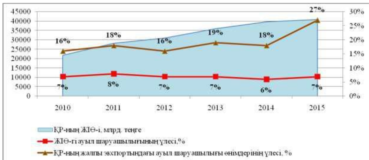
Сурет 1- ҚР ЖІӨ-гі ауыл шаруашылығының үлесі, % Алматы қаласының өңірлік қаржы орталығының рейтинг агенттігі АҚ-ның ресми сайты. Қолжетімділік тәртібі: www.rfcaratings.kz

Бірінші мәселе, өндірістің басқа салаларымен салыстырғандағы АӨК саласының даму қарқынының төмен деңгейі. Статистикалық мәліметтер бойынша ЖІӨ-гі ауыл шаруашылығы саласының үлесі біршама төмен екендігін көруге болады (1 сурет).