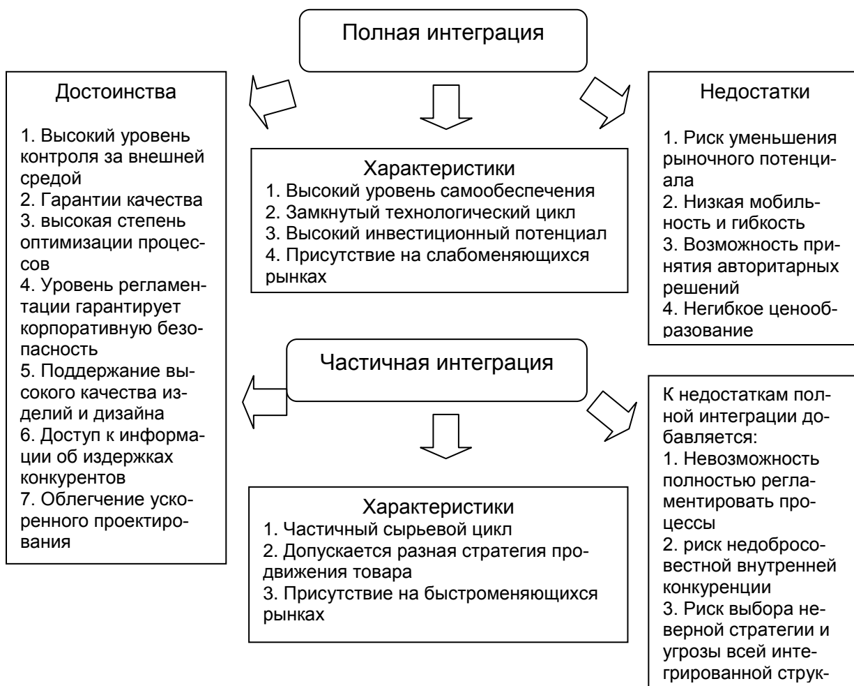
Рисунок 2 – Варианты будущей стратегии вертикальной интеграции предприятий