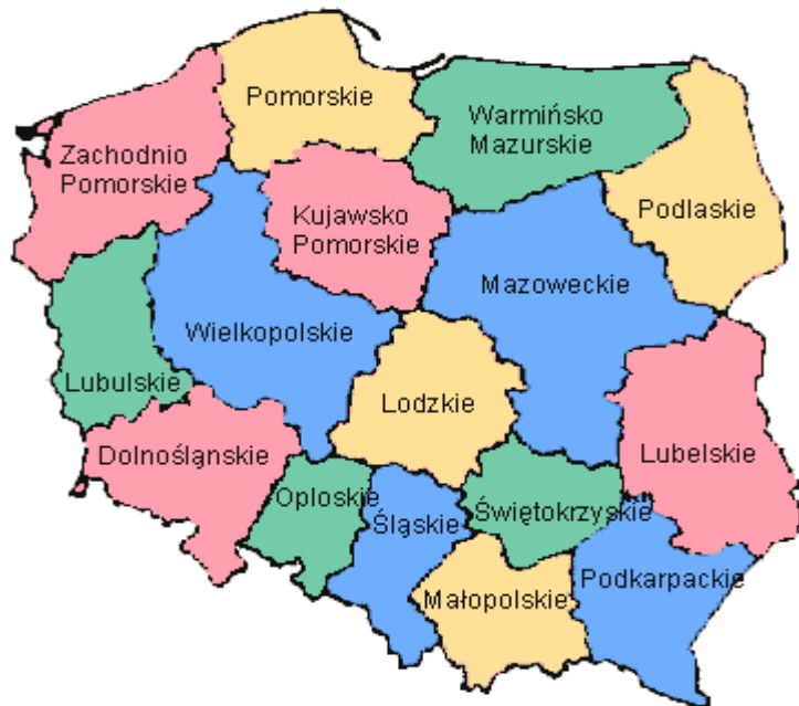
1- сурет. Польшаның әкімшілік-аумақтық бөлінуі

Польша 16 воеводствоға (1-сурет), 314 повятқа, повят құқығындағы 65 қалаға және 2 478 гминға бөлінеді [1]. Солецвалар (ауылдар) гминдердегі көмекші бірліктер болып табылады.