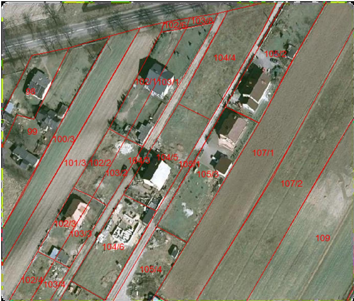
3- сурет. Ауылдық аудандардың көпфункционалдылығы

Польшадағы ауыл шаруашылығы өндірісінің жағдайлары, әсіресе, Еуропалық Одақтың ауыл шаруашылығымен салыстырғанда әр түрлі. Ауыл шаруашылығы кішігірім аудандармен, жұмыс істеушілердің үлкен санымен, қоршаған ортаның экологиялық жағдайына қолайлы әсер ететін өсімдіктерді қорғау үшін химиялық құралдарды пайдаланудың төмен деңгейімен сипатталады. Ауыл адамдарының көптеген бөлігі өндірісті дәстүрлі әдіспен жүзеге асырады. Мал шаруашылығы негізінен өсірудің аз қарқындылығымен жүзеге асырылады, ол табиғи ортаны қорғауға жағымды әсер етеді.