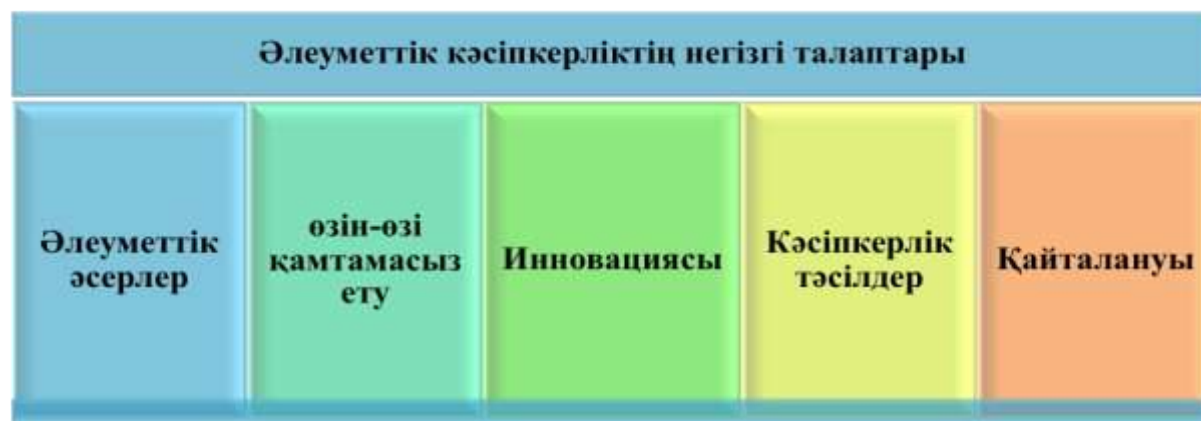
2-сурет – Әлеуметтік кәсіпкерліктің негізгі критерийлері

Әлеуметтік кәсіпкерліктің негізгі талаптары әдетте 2-суретте ұсынылған талаптарды қамтиды.